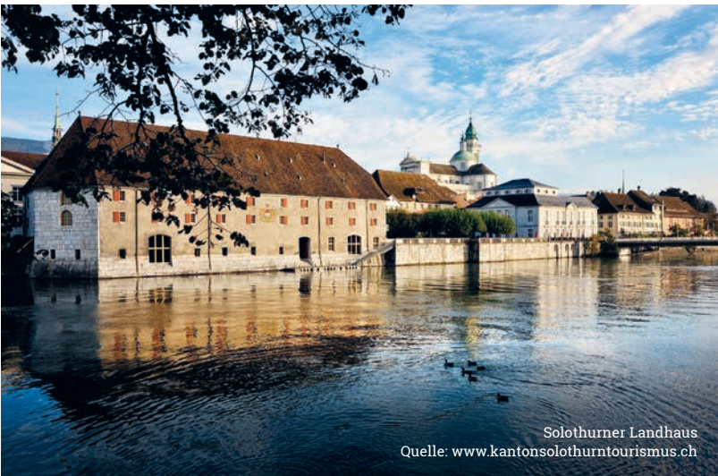
Solothurner Landhaus

18. und 19. Oktober 2024, Landhaus, Solothurn